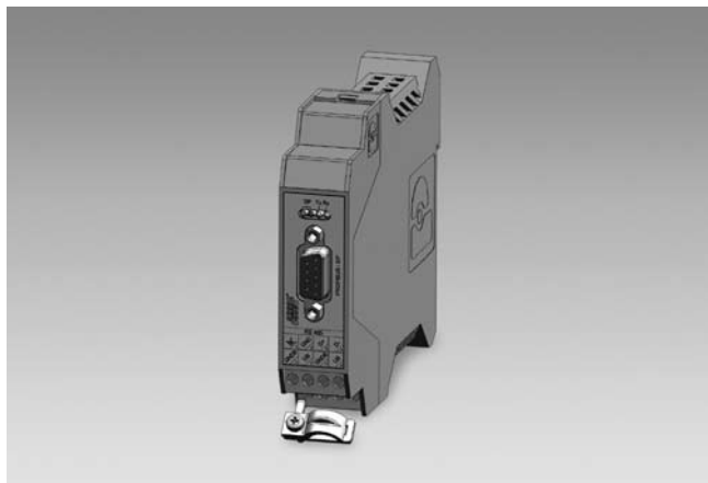
GK473 coupleur réseau Profibus-DP