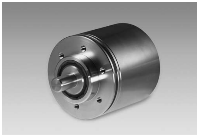
X 700 avec bride standard