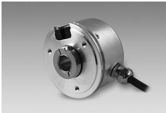
BMMH 58 SSI avec axe creux non traversant